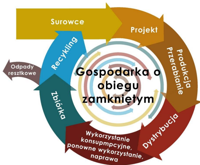
Rys. 2. Gospodarka o obiegu zamkniętym wg Komisji Europejskiej

Idea gospodarki o obiegu zamkniętym (cyrkulacyjna) stanowi alternatywę do gospodarki linearnej a jej podstawowe przesłania to: