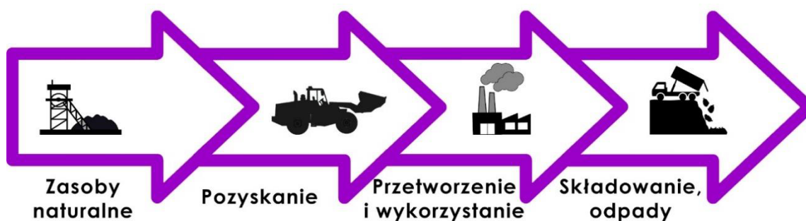
Rys. 1. Gospodarka linearna

Gospodarka o obiegu zamkniętym to globalny model gospodarczy, którego celem jest rozłączenie wzrostu gospodarczego od konsumpcji skończonych zasobów. Przedsiębiorstwa dostrzegają w tym znaczą korzyść nie tylko w podniesieniu wartości ich produktów, ale także zarządzaniu ryzykiem wynikającym z niestabilności cen oraz niepewności w łańcuchu dostaw. Zastosowanie wskaźników cyrkularności pozwala przedsiębiorstwom ocenić jak one są zaawansowane w zmianie swojego modelu biznesowego z linearnego na cyrkularny (rys. 1 i 2). Całość polega na inteligentnym zarządzaniu przepływami materiałowym zarówno w ramach cyklu biologicznego jak i technicznego. W cyklu technicznym materiałami zarządza się, ponownie użytkuje i na końcu poddaje recyklingowi. Natomiast w cyklu biologicznym materiały nietoksyczne wykorzystywane są kaskadowo i ewentualnie odprowadzane do gleby prowadząc do odtwarzania kapitału przyrodniczego.